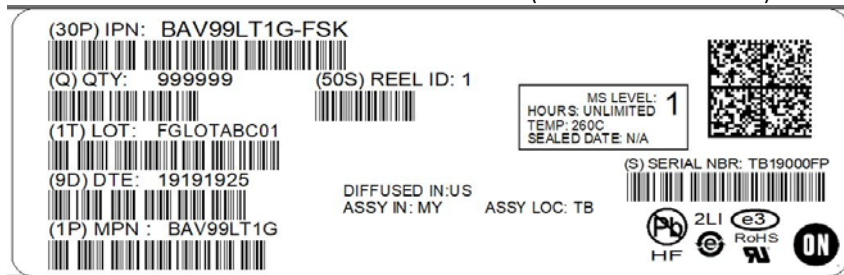
Example of Reel MPN with single digit Reel ID number, e.g. Reel ID = 1